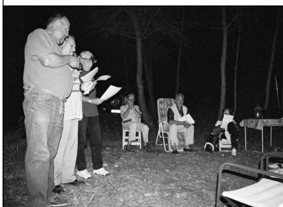
1er plan: chanteurs, au fond : le musicien et le conteur

Savions nous que le Mistral de Maillane était un familier de Fonteron ? Quelle pitié, quelle tristesse d'apprendre le sort de notre "pôvre" Pifoulet de Villevieille, innocent et crédule, rêvant à la lueur du phare de l'Espiguette que lui seul percevait du haut de la tour de notre Mas d'Escattes !