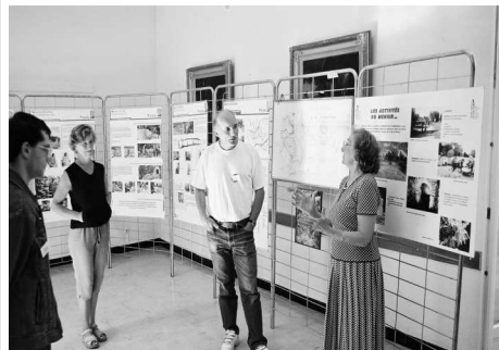
Panneaux d'exposition dans la salle des mariages