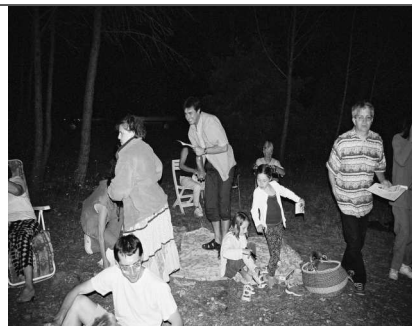
Participants à la soirée