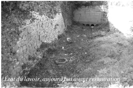
État du lavoir, aujourd'hui avant restauration