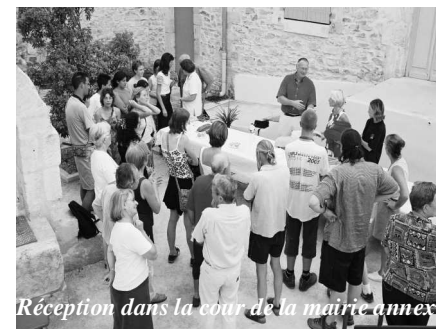
Réception dans la cour de la mairie annexe

Ce numéro de Menhir-Info , est pour moi l'occasion de rendre hommage à Jacques Cavard décédé à la mi-septembre. Le travail extraordinaire qu'il a réalisé dans la recherche de documents d'archives, nous ouvre de