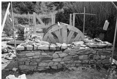
Appareil permettant la couverture du puits