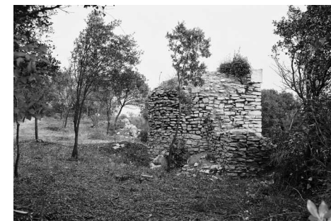
Vue arrière de l'Oratoire