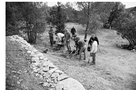
L'atelier pierre sèche au travail

La présence du plus grand nombre d'adhérents est souhaitée. N'hésitez pas : amenez vos amis.