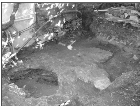
1er silo comblé, près de la maison.