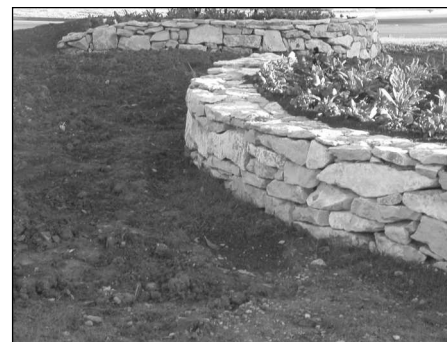
Vue sur 2 murets aménagés