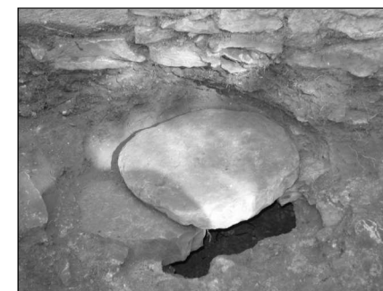
Silo effleurant le sol avec sa pierre de fermeture