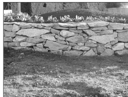
Détail du muret ouest