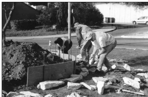
Mise en place de la première rangée.