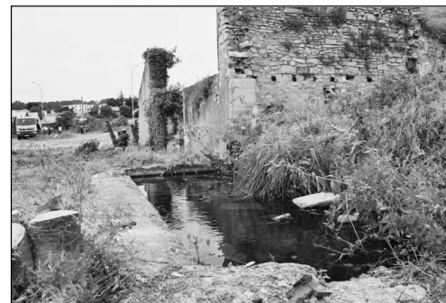
Bassin et murs extérieurs du Mas

vice régional de l'archéologie Languedoc-Roussillon : «I.N.R.A P».