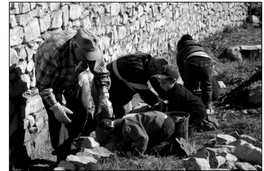
Les enfants au pied du mur