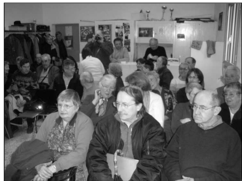
Vue partielle des adhérents lors de l'AG