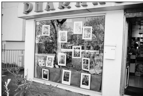
Devanture de la pharmacie