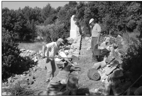
Restauration du mur de l'Oratoire