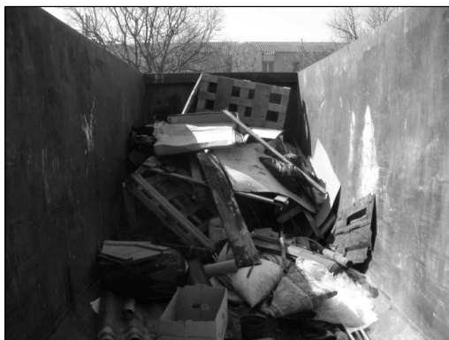
Une parties des déchets ramassés