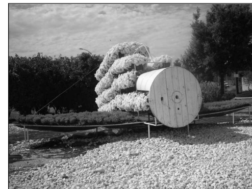
Hommage aux pionniers de l'aviation

L'Aérodrome de Courbessac fête ses 100 ans! Déjà le rond-point offre un décor végétal évoquant les débuts de l'aviation. La presse nous informera du programme de cette commémoration.