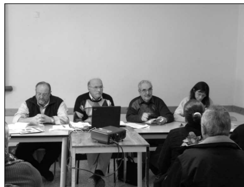
Le bureau de séance

*980 visiteurs (dont 52% d'enfants), répartis en 115 groupes accompagnés par un ou plusieurs membres de l'association.