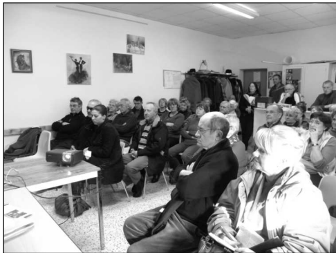
Vue partielle de la salle pendant l'assemblée générale

L'association tient à ce rôle à portée pédagogique auprès des jeunes en organisant des journées de découverte (flore, faune, bâtis...), 335 enfants de Courbessac mais également des écoles des communes voisines ont été sensibilisés à la fragilité de l'écosystème bien particulier de notre environnement.