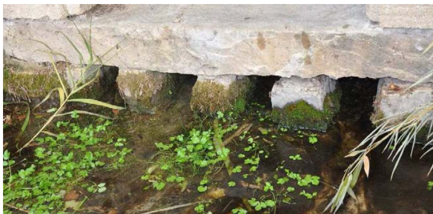
Sortie des eaux du puits de Villevieille